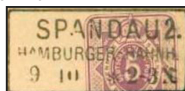
Abb. 8: 09.10.1874.