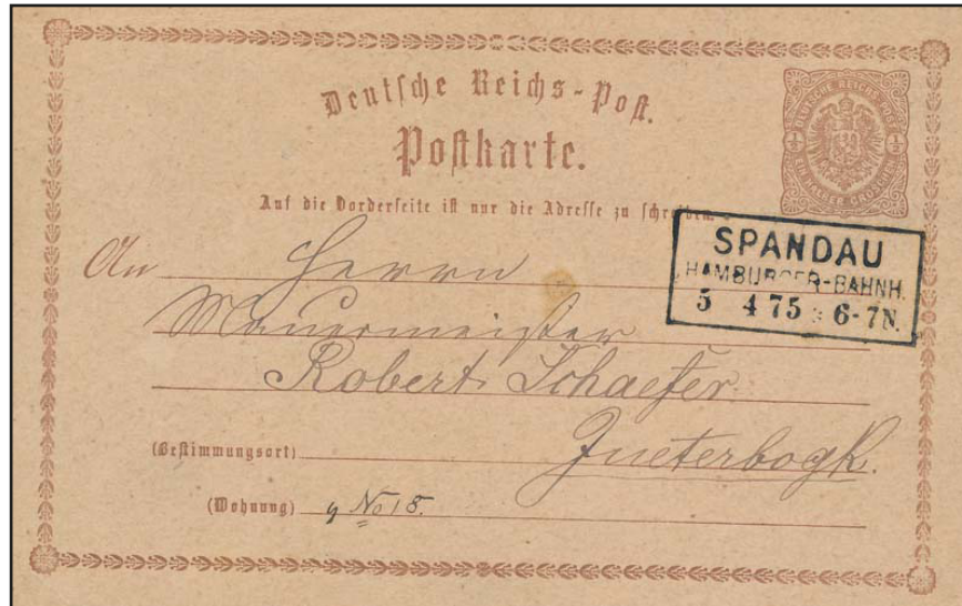
Abb. 1: „SPANDAU/HAMBURGER-BAHNH./ 5.4.75*6-7N“ Ra3 in schwarz glasklar auf DR ½ Gr. GA-Karte nach Jüterbogk. Hier bisher unbekannte Type mit Stern hinter Jahreszahl u. so eigentlich beim Stpl. „SPANDAU 2“ gelistet! Auch die Verwendung aus 1875 würde dazu passen, da nach KBHW V190 bis 10.8.74 u. V191 ab 9.10.77 gelistet ist! Würde also als neue Zwischentype genau passen! Auch im Kruschel-Handbuch unbekannt! Karte kl. Eckbug. Los 4174 der 194. Jabs-Fern-Auktion, Ausruf: 500€.

Als Bearbeiter des Handbuchs „Die Post in Spandau“ machte mich unser Vereinsvorsitzender auf das Los 4174 der Jabs-Auktion aufmerksam. Es könnte sich um einen weiteren Stempeltyp handeln.