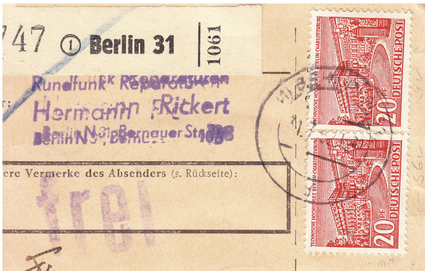
Abb. 1 und 2: Beschreibung siehe Text.

Vielleicht lassen sich die Rätsel lösen?