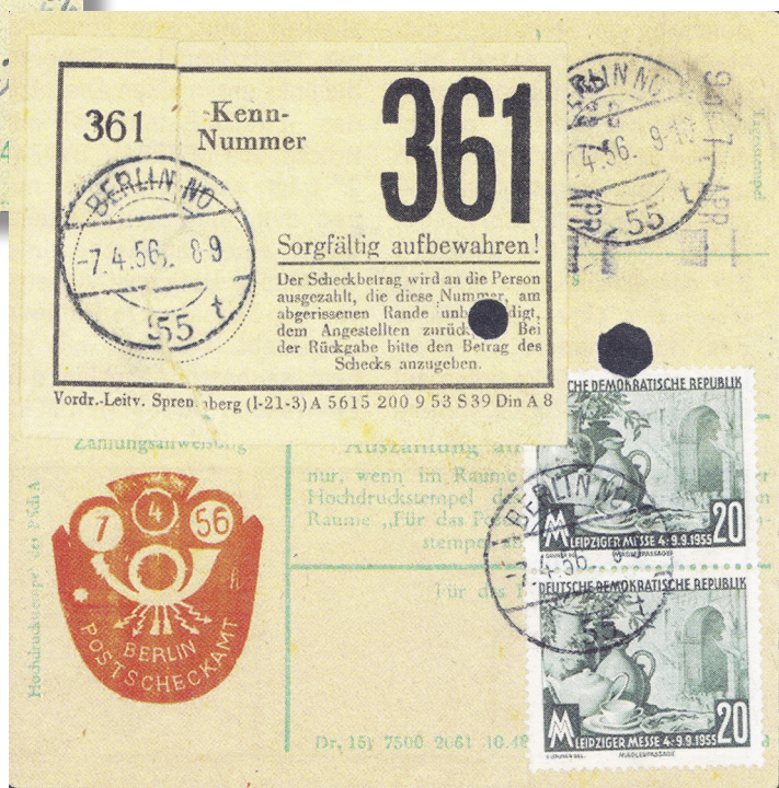
Abb. 3 bis 5: Beschreibung siehe Text.